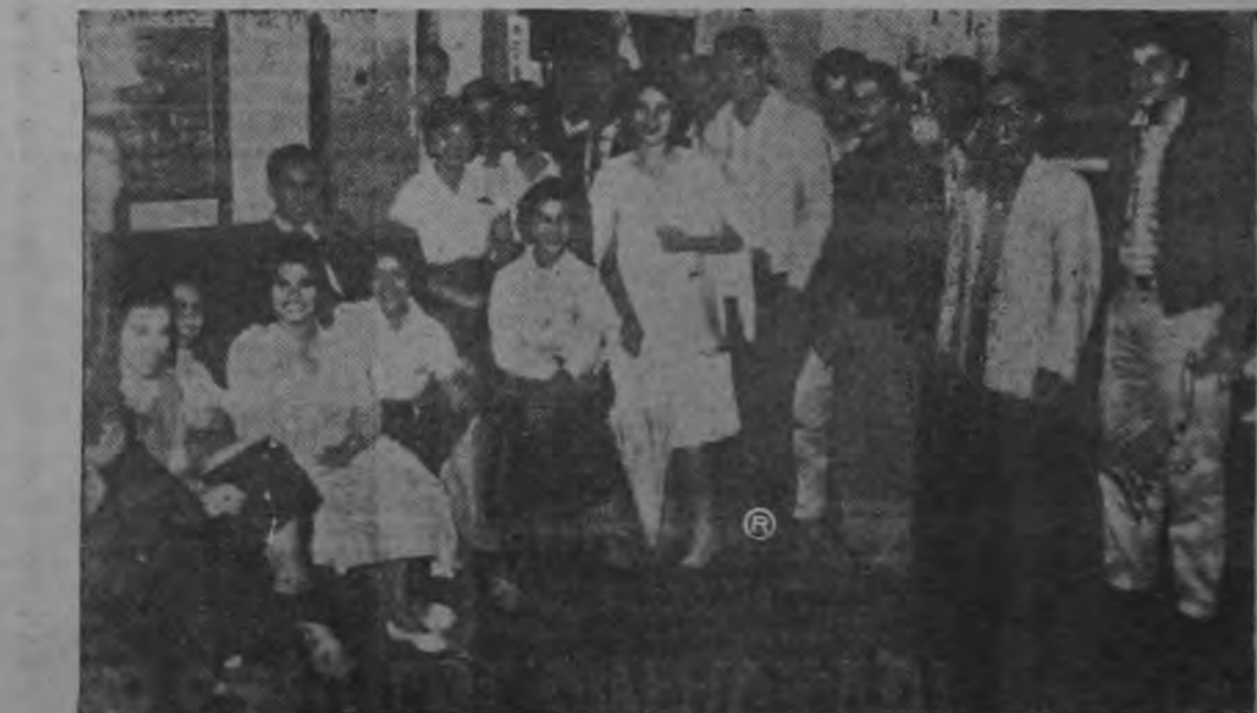
El numeroso grupo de jóvenes estudiantes de Guanacaste que ayer estuvieron en la Asamblea Legislativa apoyando la creación del noveno cantón de su provincia (Carmona o Mandayure). Después visitaron LA REPUBLICA donde Meza obtuvo esta gráfica. Son estudiantes universitarios y una delegación de la Escuela Normal guanacasteca hasta la pared de enfrente.

Ayer la Asamblea Legislativa dejó discutido en primer debate el proyecto para crear el noveno cantón de Guanacaste. Diputados de Puntarenas y Guanacaste, que antes