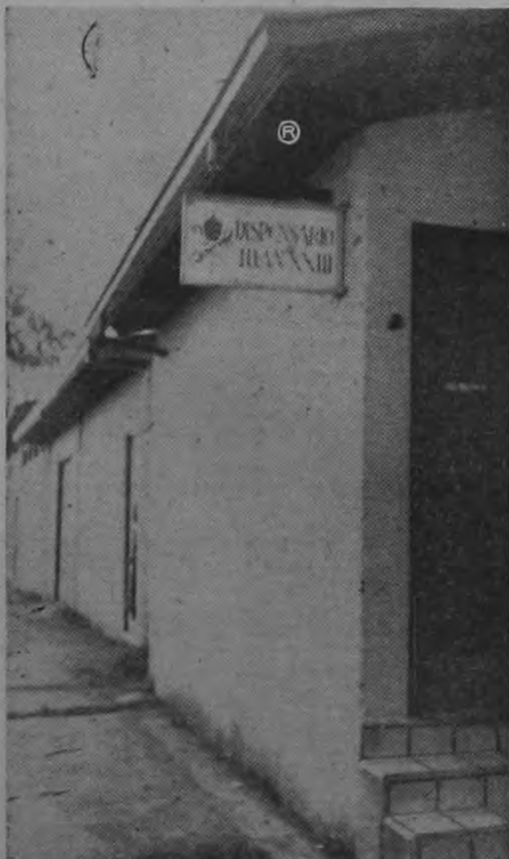
El Dispensario Juan XXIII, en el que son atendidos diariamente decenas de pacientes por 30 médicos, cuyos nombres publicamos en un marco en nuestra edición del domingo.