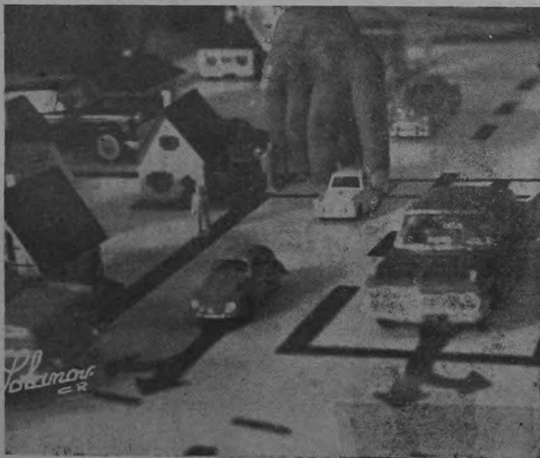
¡LA MANO DEL GIGANTE EN LA CIUDAD DESIERTA! ¡No había nadie. Aparentemente todos habían huido. Sólo dos fueron sorprendidos. Están al lado de la monstruosa mano del gigante, que atrapa al pequeño automóvil. Están irremisiblemente perdidos! Pero no se asuste, afloje esa tensión que lo tiene paralizado. Se trata de una ciudad miniatra construida por miembros de la Dirección General de Tránsito para instrucción de peatones y choferes. Todo es a escala y tanto los artefactos como señales de tránsito están completos en todas las vías. Es la materialización de una idea del Coronel Luis Quesada para instruir a los futuros choferes en los escolares de hoy. La cuestión es sumamente interesante y por esa razón, a modo de adelanto, publicamos en esta edición una de las fotografías que con un reportaje, serán publicadas el domingo próximo. La mano del gigante es la del Coronel Quesada, quien mueve un "automóvil" en una vía de baja velocidad.