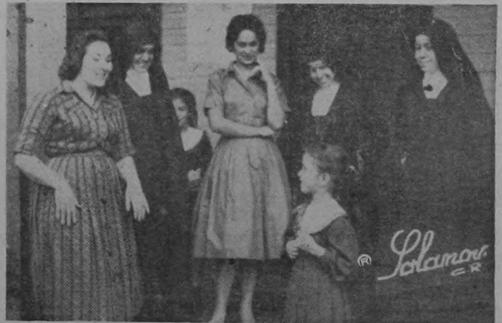
Las Hermanitas Descalzas, maestras particulares y las niñas de la escuela y el kinder, se apartan en alegre camaradería. En la Escuela del Niño Jesús de Praga, todo es alegría, amor y comprensión. La gráfica fue tomada en uno de los pasillos de la escuela.