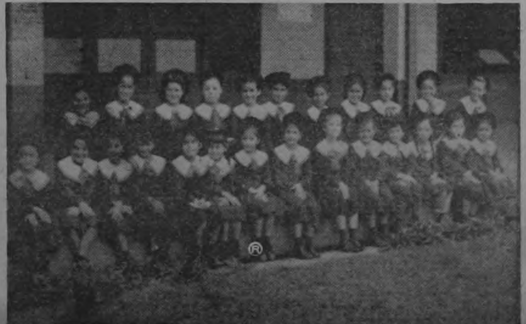
Un nutrido grupo de pequeñas, tan alegres y vivaces como disciplinadas, posan ordenadamente para la cámara de LA REPUBLICA. SOLANOV venía impresionadísimo con la conducta de las niñas, y nos felicitamos a todas por su comportamiento cuando recibíamos este material.